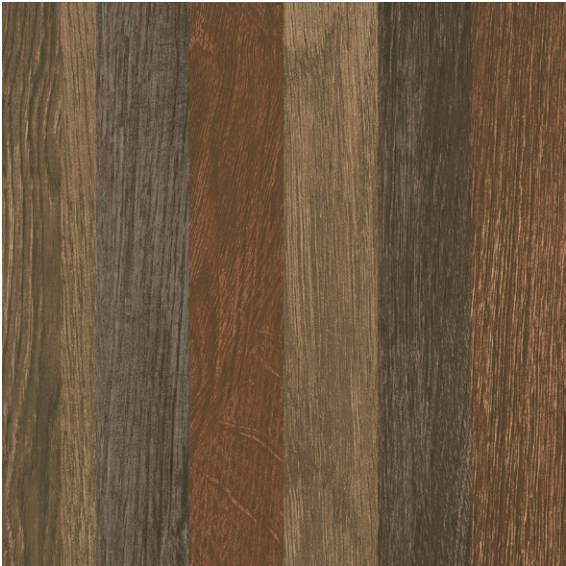
CAFÉ ZBT9 37 X 37 CM